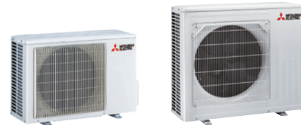
MUZ-FT 25 VGHZ